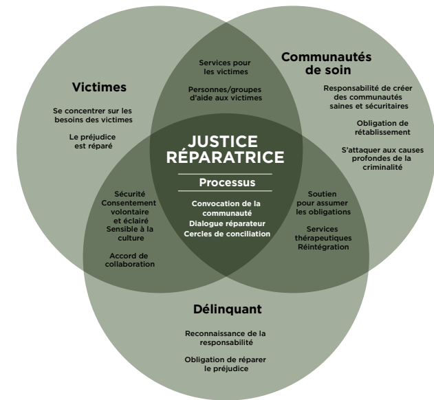
Comment fonctionne la justice réparatrice

Le principe de base de la justice réparatrice est qu'il faut comprendre que la criminalité cause du tort aux personnes et aux relations et qu'elle entraîne des répercussions sur la collectivité. Trois croyances en découlent :